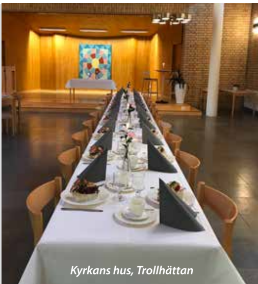
Kyrkans hus, Trollhättan

I alla förslag ingår fullständig servering och en vacker dukning med vita dukar, vitt porslin, blommor samt stearinljus.