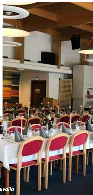
St. Mikaelsgården, Uddevalla