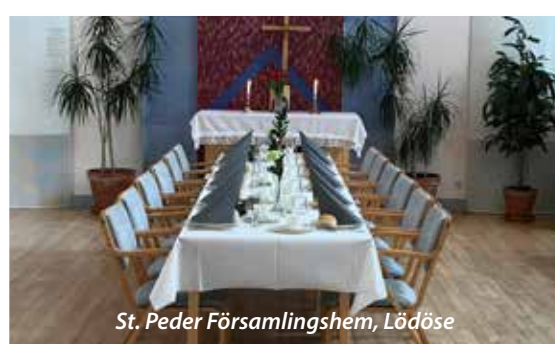
St. Peder församlingshem, Lödöse