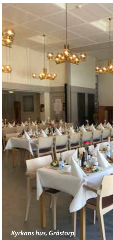
Kyrkans hus, Grästorp